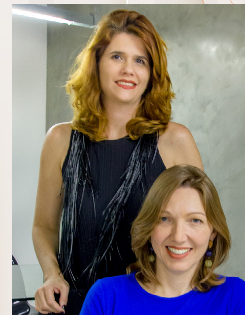
Porto Neves Arquitetura Projeto de ambientação

A proposta de arquitetura paisagística aposta na vegetação como elemento principal para dar forma e vida aos diversos espaços do jardim do Casa Moser. Através do jogo de luz e sombra, texturas e cores, as plantas deste jardim se entremeiam nos espaços criando ambientes lúdicos e acolhedores, que estabelecem relações entre o público e o privado, entre o contemporâneo e o clássico. Um jardim onde a natureza se sobrepõe e une.