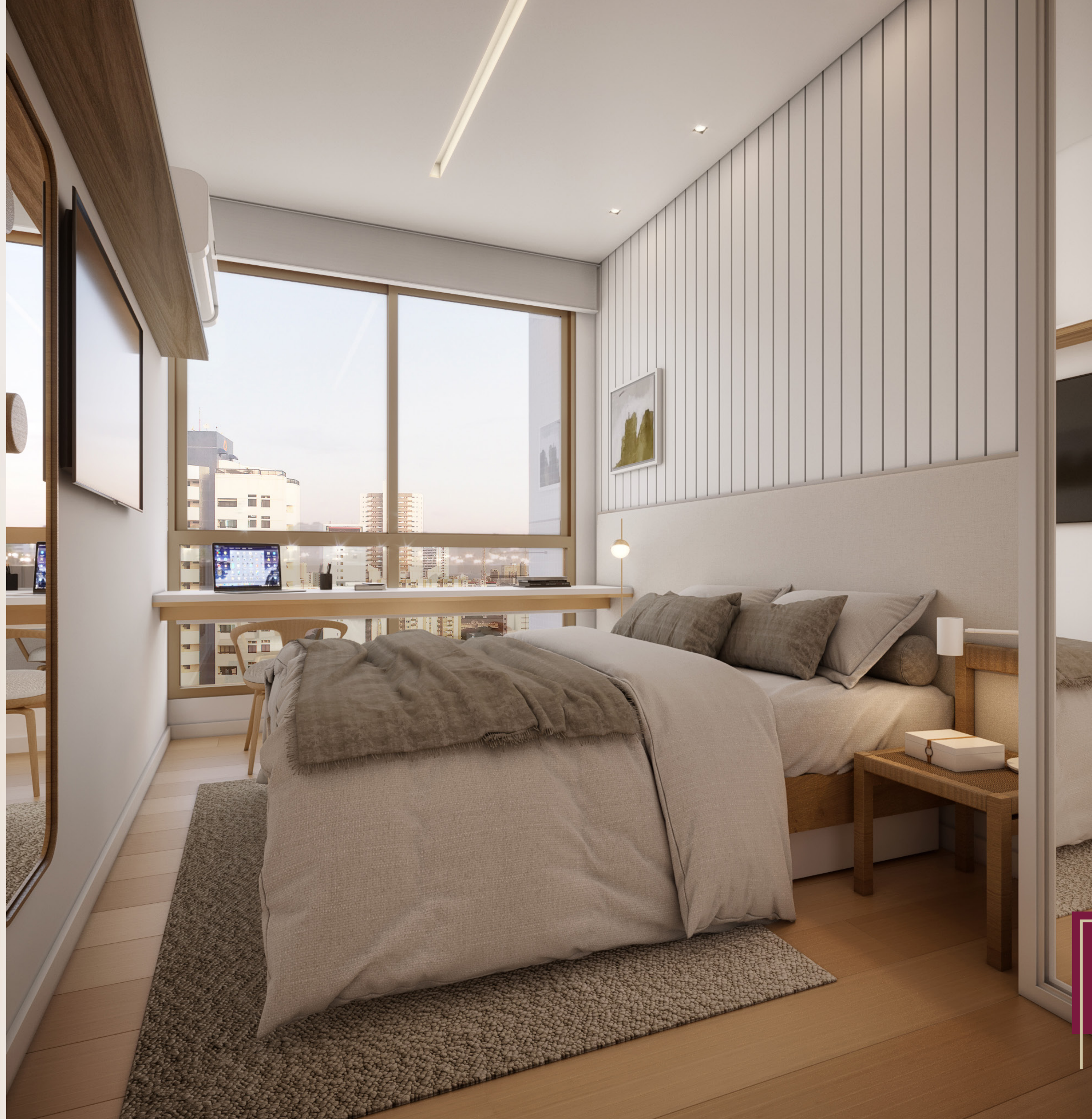
Suíte Terminação 10