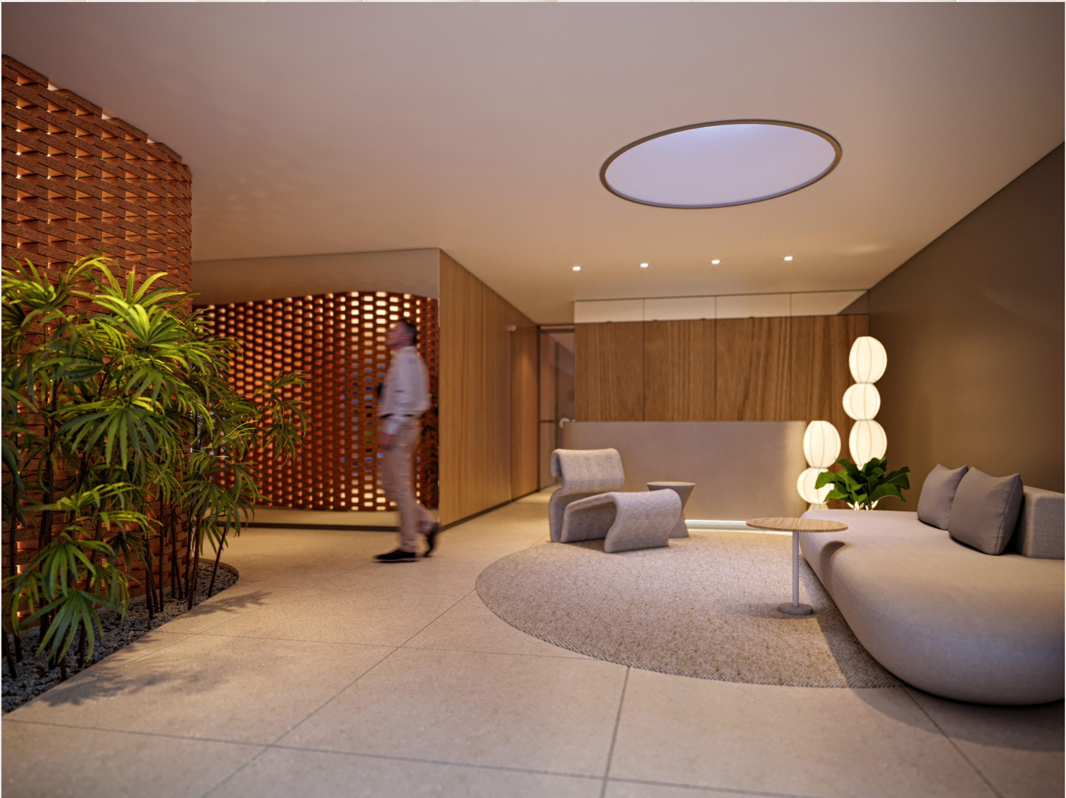
Hall da Torre