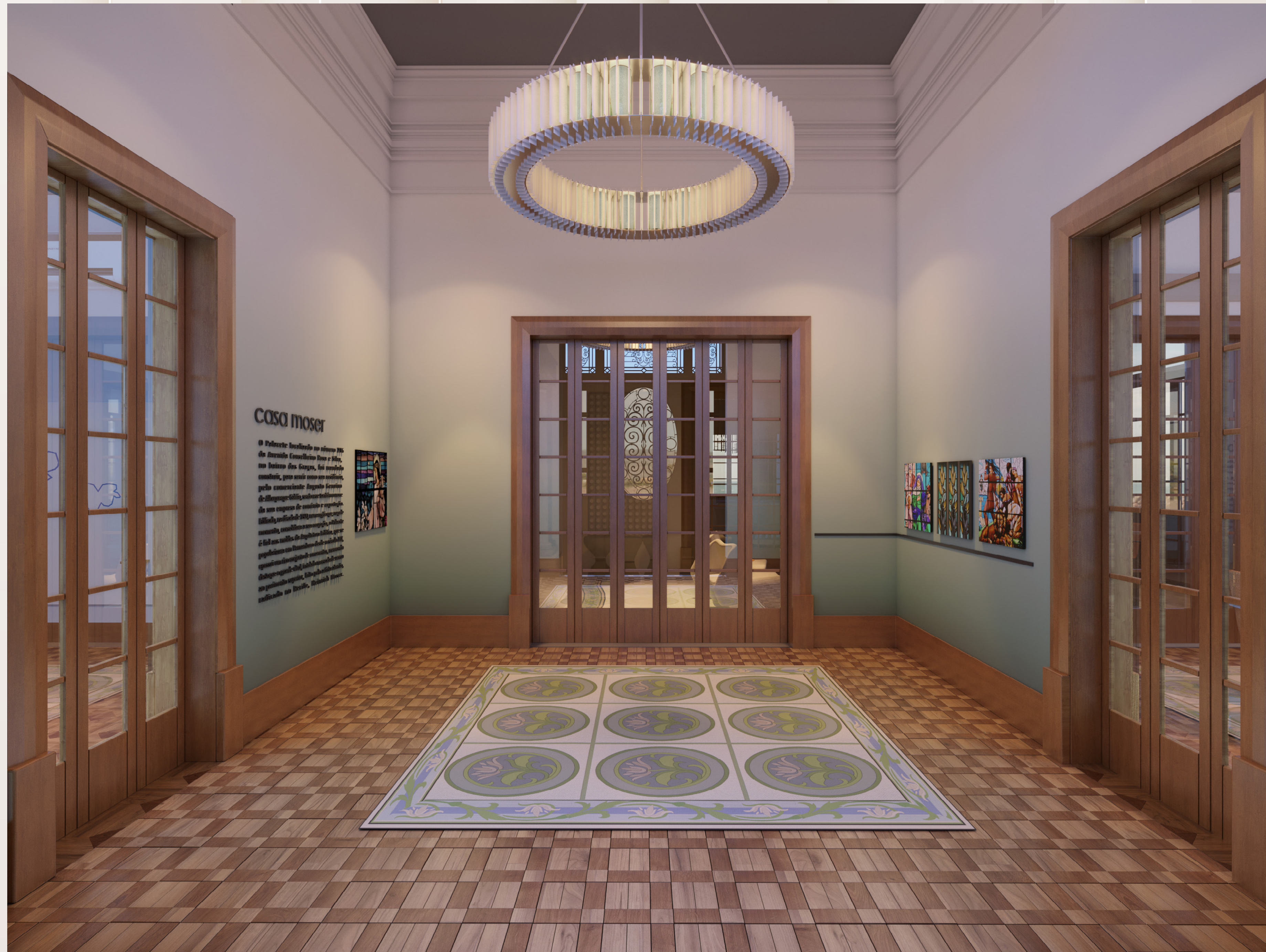
Hall Social com galeria de arte