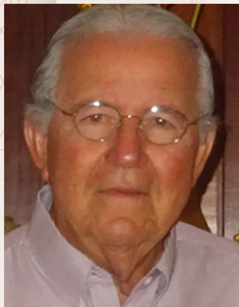
Carlos Fernando Pontual Projeto de arquitetura

O icônico casarão requalificado, que abrigará salão de festas, academia, espaço gourmet, coworking e brinquedoteca, é o centro da praça de árvores centenárias, onde ergue-se na sua retaguarda como moldura, a torre do Ed. Casa Moser. Suas fachadas ornadas de jardineiras, que serpenteiam de forma singular, harmonizam com esse exuberante jardim circundante ao casarão. Os apartamentos se abrem para o leste e o norte, buscando o melhor horizonte e ventilação.