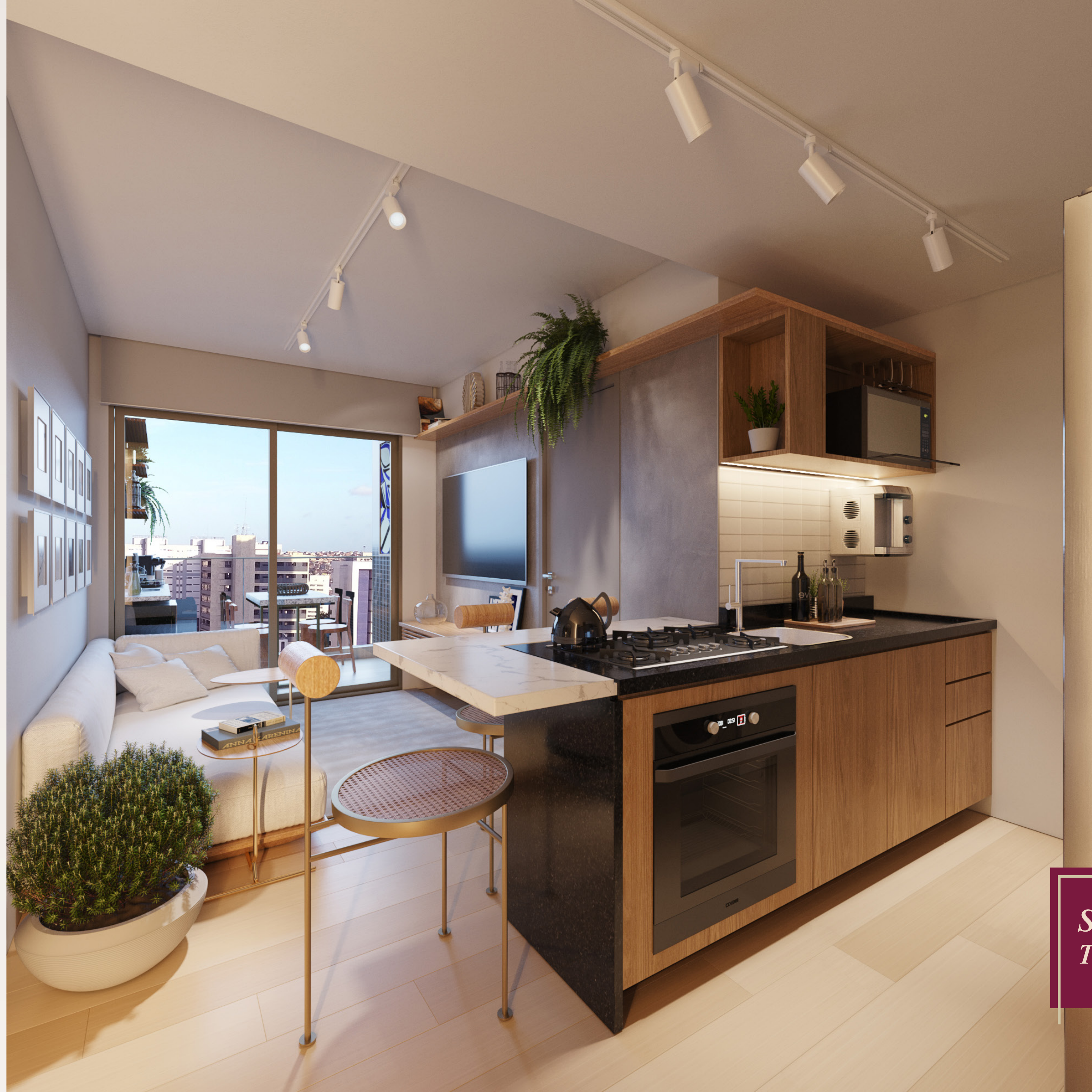
Sala com cozinha integrada Terminações 4 e 8