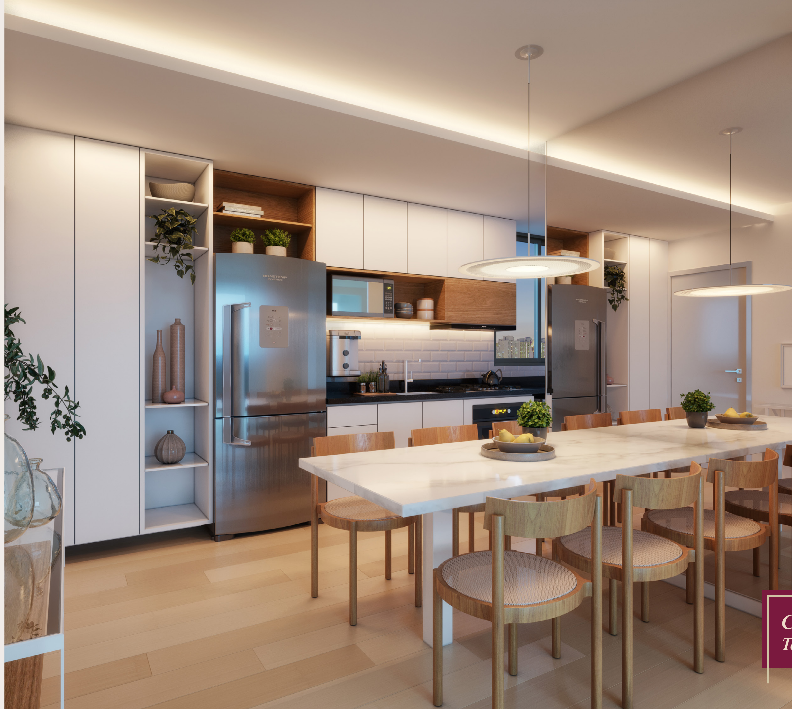
Cozinha integrada Terminação 1