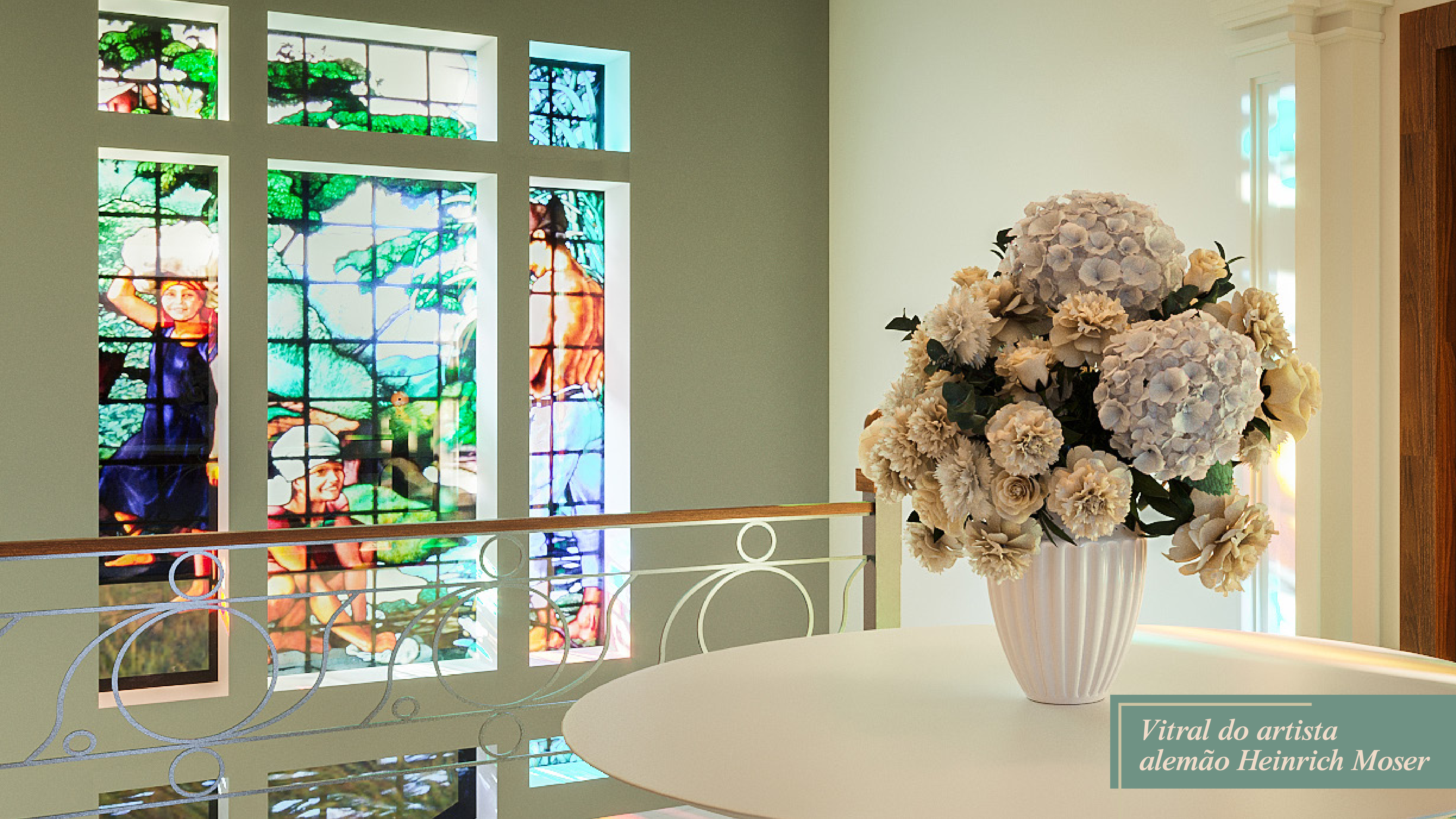
Vitral do artista alemão Heinrich Moser