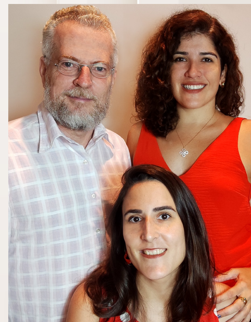
Ateliê Canópia Arquitetura e Paisagem Projeto de paisagismo

O icônico casarão requalificado, que abrigará salão de festas, academia, espaço gourmet, coworking e brinquedoteca, é o centro da praça de árvores centenárias, onde ergue-se na sua retaguarda como moldura, a torre do Ed. Casa Moser. Suas fachadas ornadas de jardineiras, que serpenteiam de forma singular, harmonizam com esse exuberante jardim circundante ao casarão. Os apartamentos se abrem para o leste e o norte, buscando o melhor horizonte e ventilação.