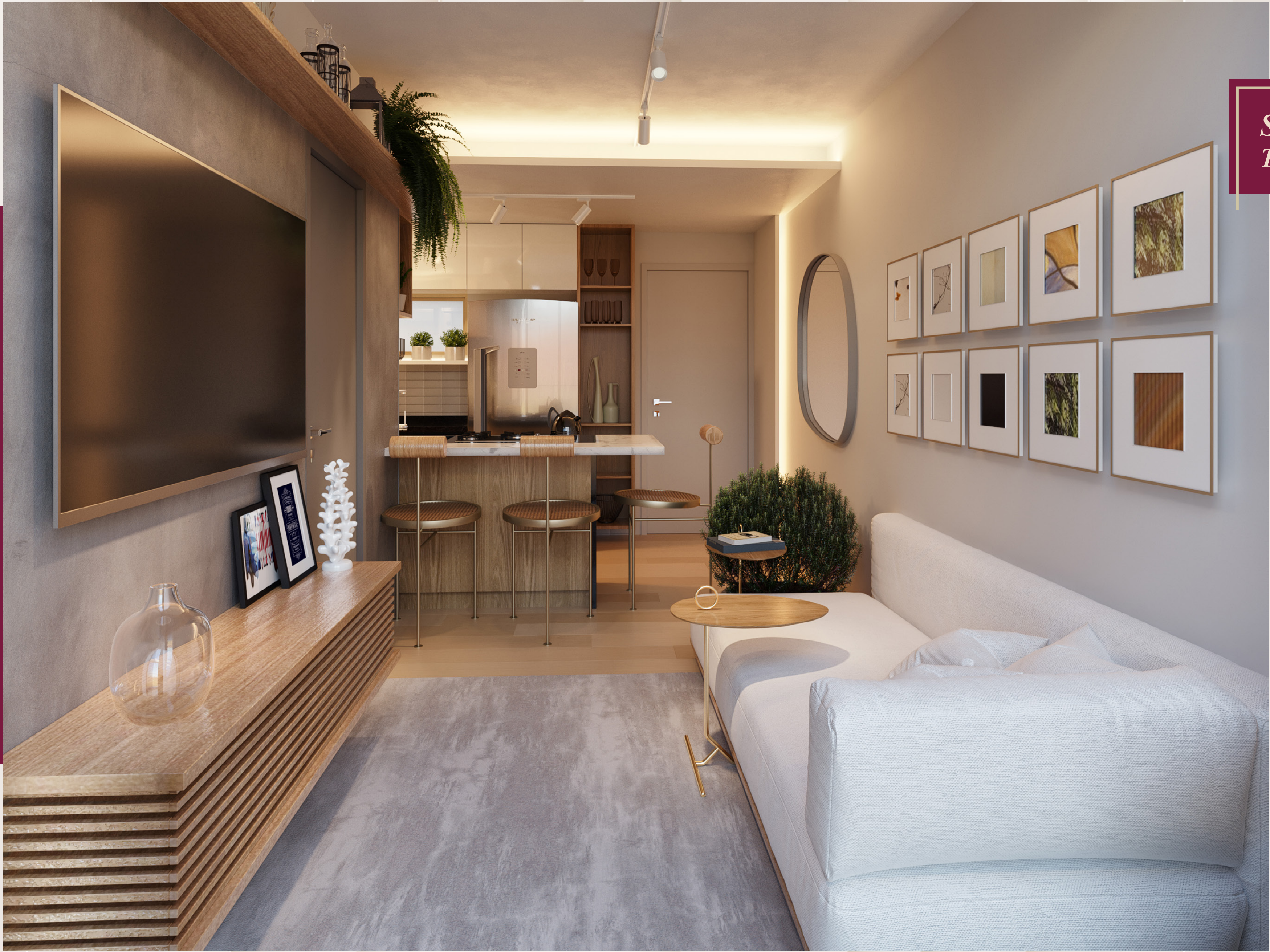
Sala de Estar Terminações 4 e 8